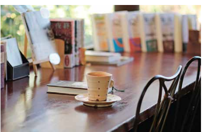
ライブラリーカフェ然々 松戸町 2-8-17 ㊟定休

友人に紹介されて訪れた「ライブラリーカフェ然々」は、読書するのに最適なスポット。店内は書物がたくさんあり、ちょっとした図書館のようになっていてワクワクします。食事もおいしくて、チーズケーキが絶品です。とにかくお店の雰囲気がすてきで「おひとりさま」にも優しいお店なので、また行きたいなと思っています。